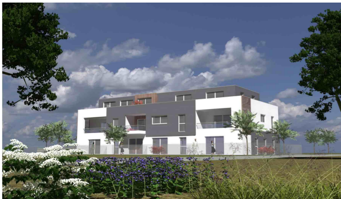
VUE COTE JARDIN