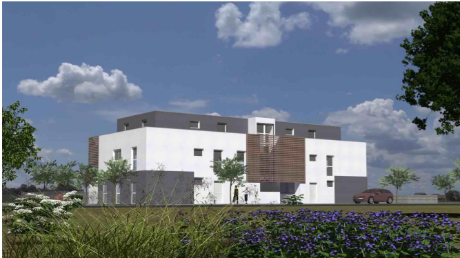
VUE COTE RUE